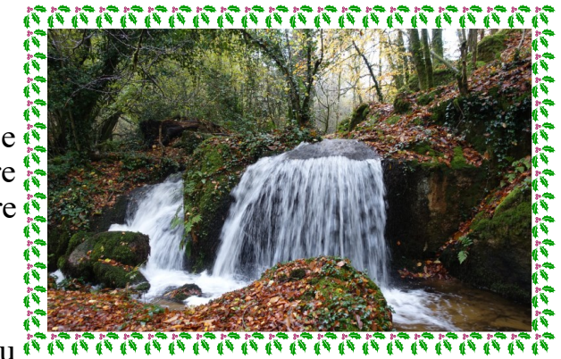
Cascade des lionnes