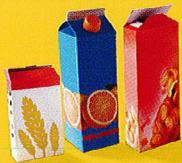
BRIQUES ET EMBALLAGES EN CARTON